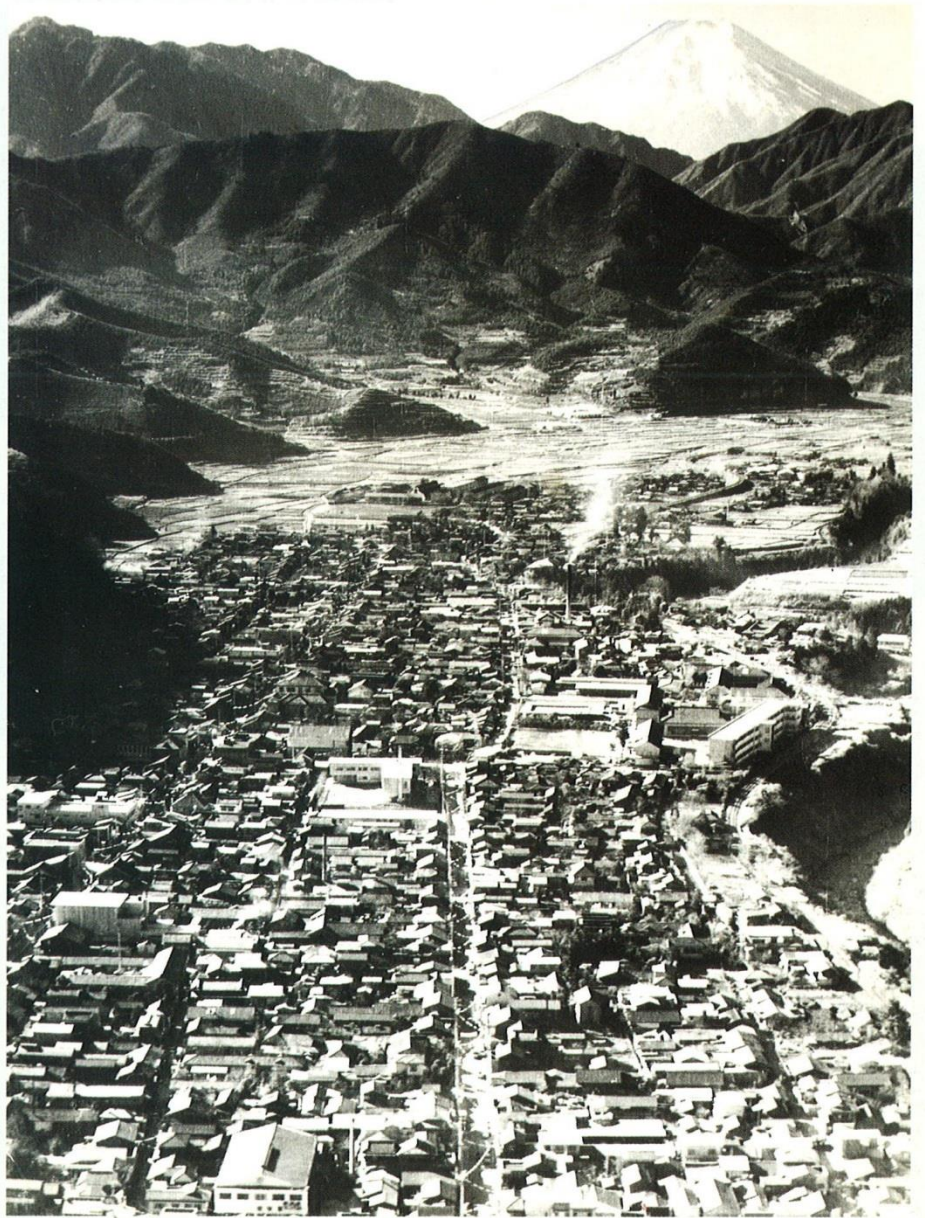
ふるさとの [想い出写真館]