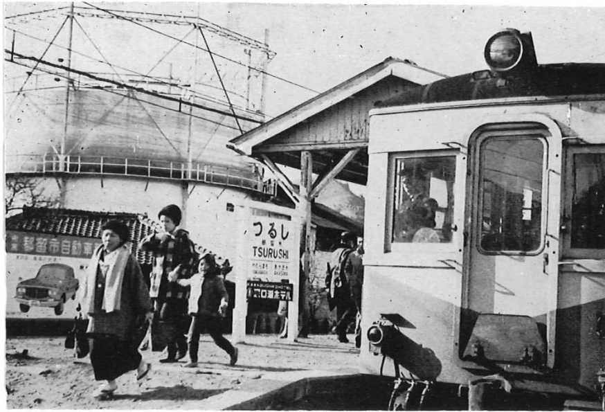
富士急行 都留市駅