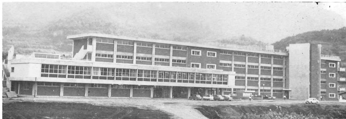
都留文科大学本館

この完成により名実ともに備った大学としていよいよあらたなる発展と充実がはかられることになる。