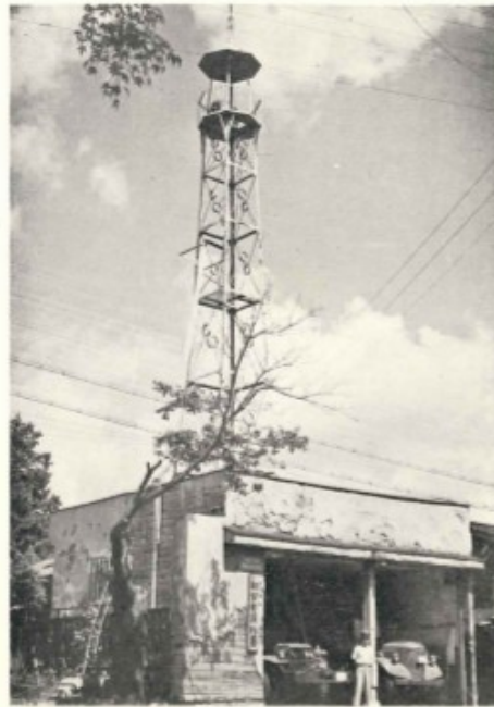
消 防 署