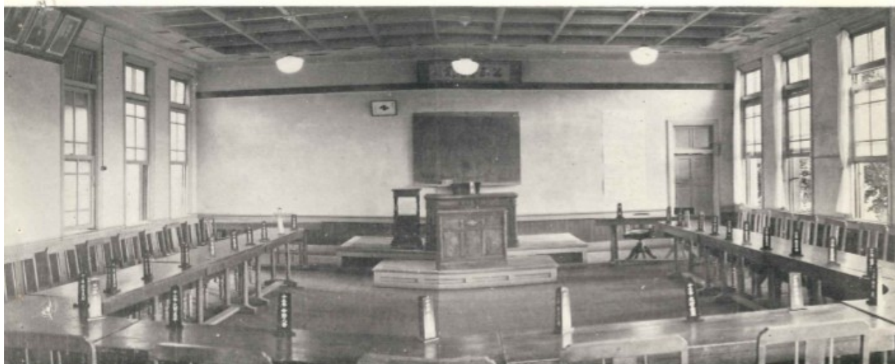
議 會 議 場