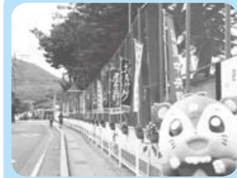
幟旗がたくさんあってわくわく！お祭りってかんじ！