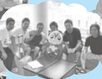
着替え前の出演者さんたちとのワンショット☆ほくってほんと人気者♪