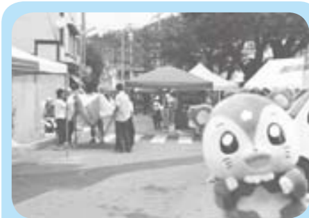
B級グルメも出店準備！！お祭りの夜は歩くのも大変なくらい大賑わいだったね！