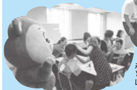
お化粧中だね！どんな顔になるのかドキドキ…♡