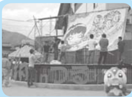
谷村第一小のメイン会場では八潮inつるのステージを作ってるよ！ほくの踊りも披露したいな☆