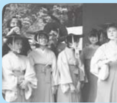
留学生達も準備万端！いざ大名行列へ～

—大名行列にお殿様として出演されてみてどんなお気持ちでしたか？ 今年は何道の広い通りを使えたこと、お姫様が都留市出身ということもあり、市内からも多くの人が駆けつけ人の多さに圧倒されました。古式に習った壮大な大名行列は、まるでタイムスリップしたかのような異様な面白さがありましたし、その時代絵巻の中心に自分があることに夢心地でした。 —雨が途中から降ってきましたがどうでしたか？ 馬の上からよく見えたのですが、沿道は人で埋まっており、人の波が切れることなく繋がっていました。谷村第一小付近で雨がひどくなりましたが、それでも沿道にたくさんの方がいてくれて大変感動しました。自分自身も気持ちが入り込んでいた