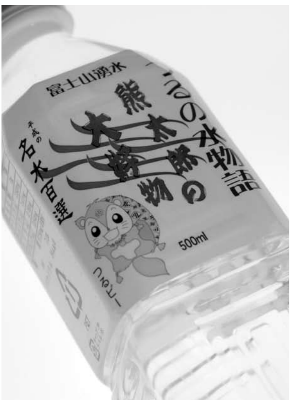
■現在使用中のラベル