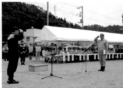
10月24日 山梨県地震防災訓練開催

都留第一中学校と、住吉球場において、大規模な地震防災訓練を山梨県と合同で開催しました。当日は、三吉・開地地区の自主防災会による避難所訓練の他、自衛隊や消防署などの各種団体による訓練も行われました。