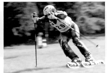
8月20日～22日 第6回都留市ジャパンジュニア グラススキー大会開催

鹿留のサンパーク都留グラススキー場において、小中学生・高校生を対象としたグラススキーの全国大会「第6回都留市ジャパンジュニアグラススキー大会」が盛大に開催されました。