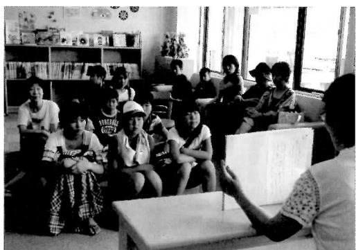
8月6日(金)に、「ひびきの会」が戦争と平和をテーマとした読み聞かせ会を開催しました。

図書館ボランティアによるおはなし会の日程は、「情報クリップつる」内の、「子育て情報コーナー」「とかちび」に掲載しています。そちらもご覧ください。