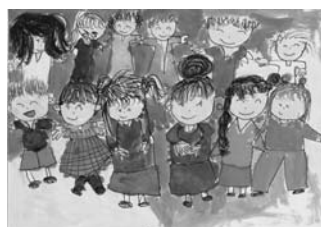
谷一小 1年 庄司愛理