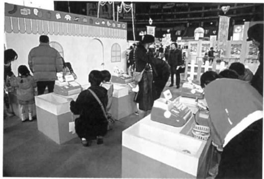
お買い物ゲームコーナー