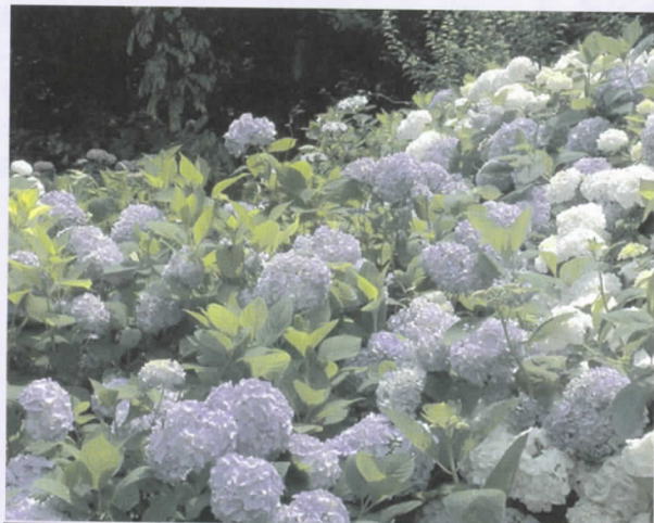
「楽山公園に花を咲かせる会」が発足し、花木の手入れなどを行っています。桜、紫陽花、萩などきれいに咲き誇る時期に楽山公園に足を運んでみてください。