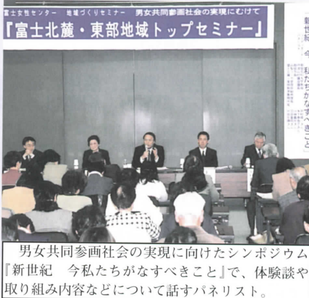
男女共同参画社会の実現に向けたシンポジウム『新世紀 今、私たちがなすべきこと』で、体験談や取り組み内容などについて話すパネリスト。