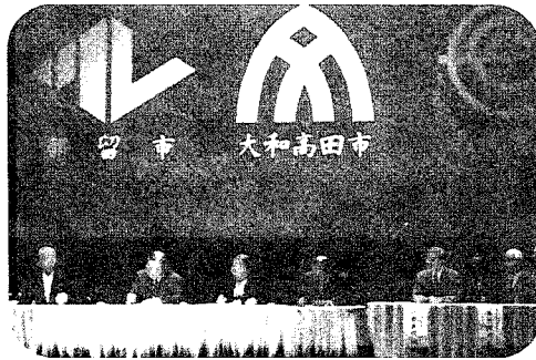
協定書に調印する都倉市長

都留市では、県内六市および東京都板橋区、都留郵便局と協定を結んできましたが、去る十月十八日(土)、国体開催の縁をもって奈良県大和高田市と大規模災害時における相互援助に関する協定が取り交わされました。これにより、災害時に頼りになる支援都市の広域化が図られ、応急復旧対策などに大いに役立つものと期待されます。