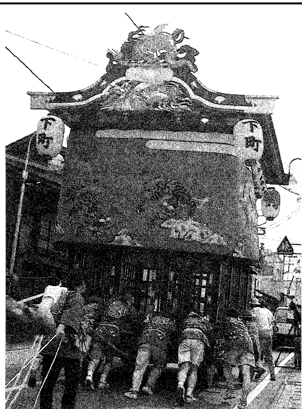
六十数年ぶりに復活した下町屋台の巡行

八朔祭屋台の創建年代は、飾幕の製作年代等からみて文化年間（一八〇四〜一七）と推定されています。