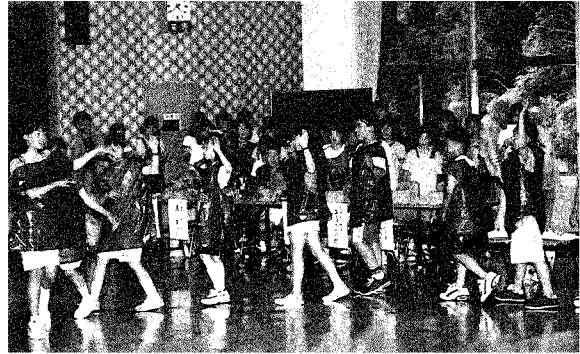
釧路の子どもたちが寸劇を披露

北海道釧路市から子どもの船一行53名が都留市を訪れました。歓迎式では、プレゼントの交換や寸劇の披露など和やかな雰囲気のうちに進み、旅の疲れも感じさせない子どもらしい一面を見せてくれました。また、市内の小中学生と鹿留川でバーベキューやますのつかみどりを、グリーンロッジでは、カンを使ってのハンゴウすいさんやキャンプファイアーを楽しみ、都留の自然を満喫しました。