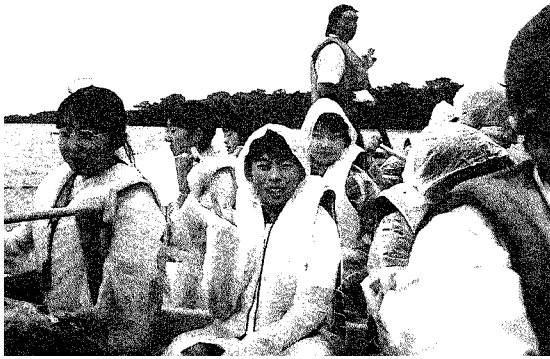
釧路湿原をカヌーで下る