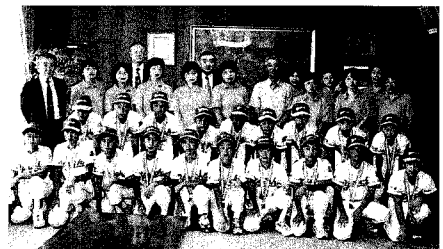
市長に準優勝の報告

なお、関東大会では神奈川県代表チームと対戦し、二対三で惜敗しましたが山梨県の代表らしく、のびのびとしたプレーで健闘しました。