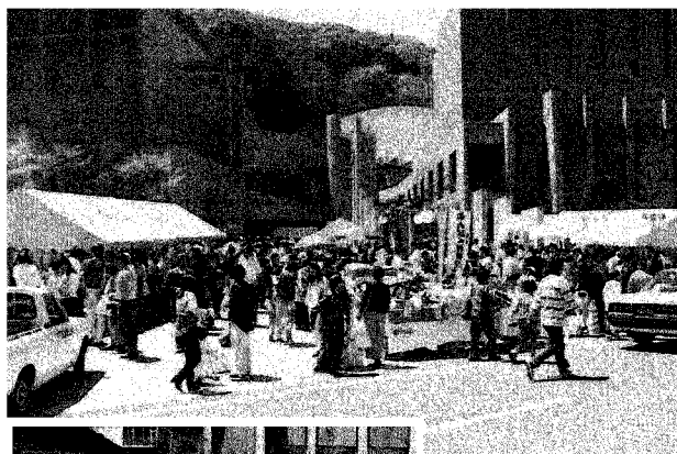
青空市(上)と ミニ四駆大会(左)