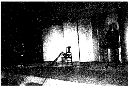
第3回生涯学習フェスティバル “古典芸能に親しむ会：筑前琵琶”