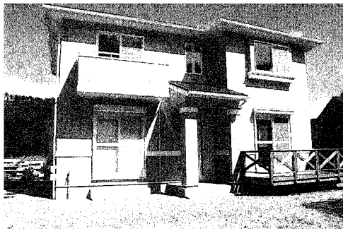
Na 7 2 × 4 住宅