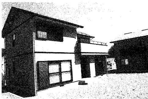
Na 10 規格型住宅