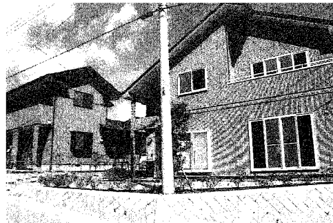
Na 2 在来工法住宅