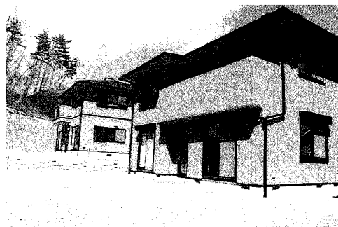
Na 8 規格型住宅