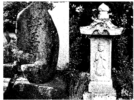
勢至尊菩薩塔 四日市場公民館前 与繩日影天正寺入口

二十三夜のお月さまは、勢至菩薩の化身といわれています。勢至菩薩は、観音菩薩とともに阿彌陀