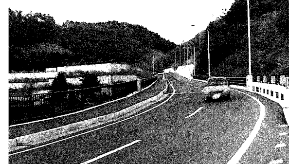
昨年開通した柄杓流橋

には懸案となっております中央自動車道都留インターのフルインター化、国道一三九号都留バイパス第二工区の早期着工といった重要な課題が山積しているところでありますが、二一世紀に向けてこれらを積極的に推進していかなければなりません。