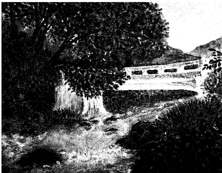
中学校の部大賞『鹿留川の流れ』