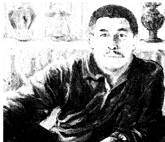
高校生の部大賞『父』