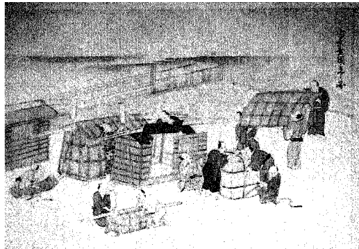
宇治御茶壺之巻のうち御茶壺固立之図 茶壺を梱包しているところ

制度がどんなものであつたかについては、歩行頭役 かちしやく の者が責任者となること、責任者は巡年制で交代すること以外わかりませんが、それまでは年毎に違つていた行列の規模や運ぶ壺の数、求める茶の量、宿泊地などと共に往路は東海道、復路は甲州街道というような道中コースも決められたと思われ