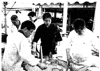
飲食店組合の皆さんご苦労さまでした