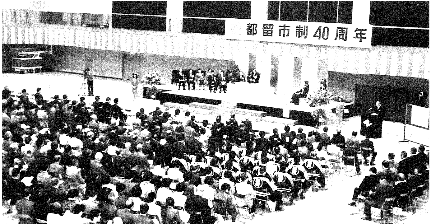
市制40周年記念式典