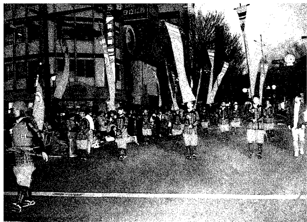
甲府平和通りを行進