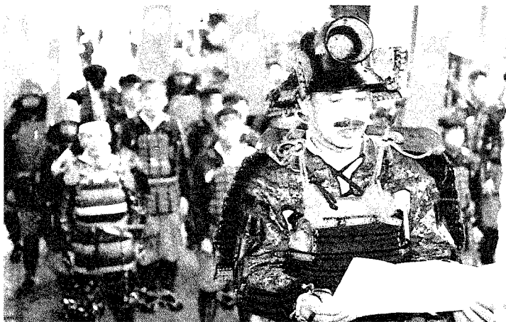
大神宮で出陣祈願

出陣に際し、公私共にお忙しい中、ご出演いただきました宝分団の皆様をはじめ、関係機関の方々に心より感謝申し上げます。