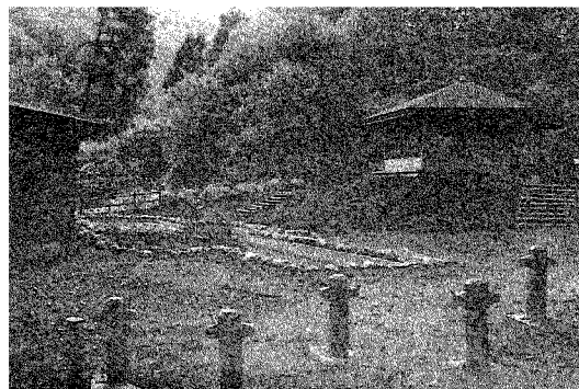
いきものふれあいの里

以上年頭にあたり抱負を申し述べましたが、今後も市民総参加・対話の市政を推進し、活力とうるおいのある都市を目指し全力を上げ取り組んでまいります。 市民の皆様より一層のご支援ご協力をお願いして新年のごあいさつといたします。