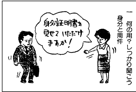
一 何の用でしつかり聞こう 身分の用件