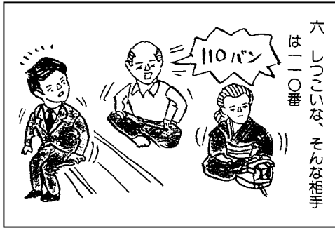
六 110番 はしごいなく、そんな相手 は110番