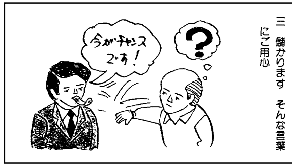
三 儲かります、そんな言葉 にご用心