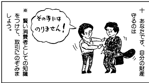
※ 賢い消費者としての知識 をつけて、取引にのぞみま しょう。