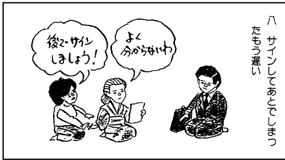
八 サインしてあとでサイン たもう進い