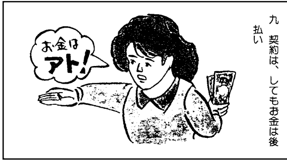
九 契約は、してもお金は後 払い