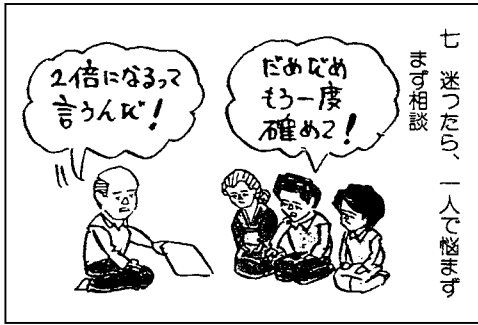
七 迷ったら、一人で悩まず まず相談