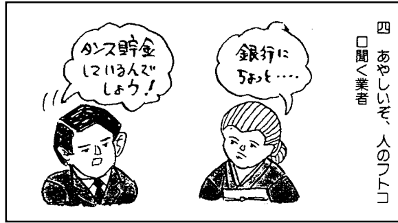
四 あやしいぞ、人の「アト」 に聞く業者