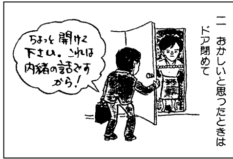
二 おかしいと思ったら必ず ドア開けて