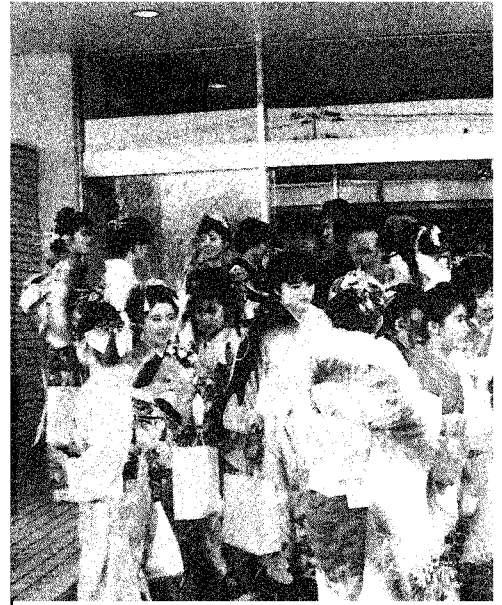
▲華やかな雰囲気にも包まれ

の仲間入りです。これからは、今より一層自覚し、責任感を強くもち、社会にも広く関心の目を向けていかなければならないでしょう。この日を期に、もう一度自分というものを見つめなおしよりよい人生を築いていきたいと思ひます。