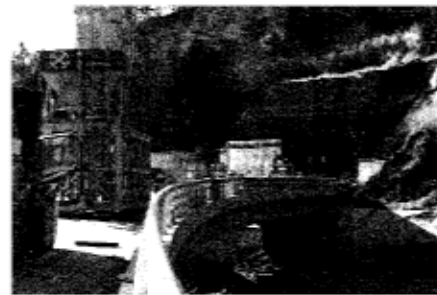
◀ 国道バイパス 都留トンネル

都市計画街路四日市場・古 川渡線の新設改良や土地改良 総合整備の終わった厚原地区と つる五丁目地内を結ぶ牛石橋 の架設、その周辺道路の整備 を強力に進めてまいります。