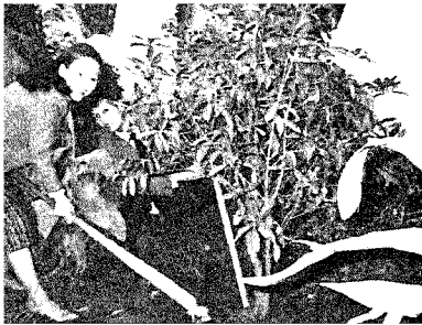
▷ 百花園でキンモクセイを記念植樹

そうした中で人々は、黙々と働いています。繁栄の頂上に存在している事実を私達は認識しなければなりません。日本の良さを痛感した十三日間、こうした貴重な体験は、今後に役立てなければなりません。