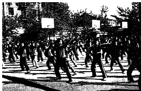
◁ 西安の小学校 日本のラジオ体操みたいであった

海外にいったことのない私にとって、第六回日中友好山梨県訪中青年の翼はとても有意義でした。北京に着くまで体の中は不安と緊張でいっぱいでしたが、いざ着いてみると、まだ国内にいるような錯覚にとらわれました。見学したお寺も、街にいる人々もど