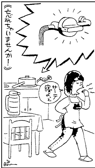
火のもとの点検を!

11月26日(土)から12月2日(金)までは「秋の全国火災予防運動」の期間です。ことしは「点検は防火のはじまりしめくくり」を統一標語に1週間、火災予防運動が行われます。年末を控え、なにかとあわただしく、ストーブなど火の気を使う機会も多くなります。気持ちを引き締めましょう。