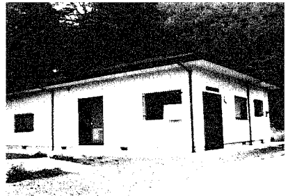
▲三吉地区転作促進センター