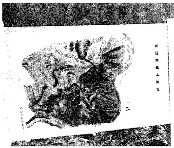
▶城山登り口に建てられた説明板

めに、市役所庁舎前、お城山登り口、お城山山頂の三方所に文化財説明板を設置しました。