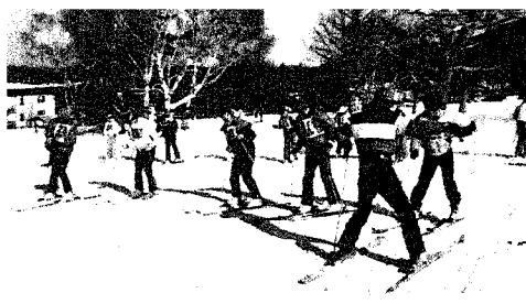
▲昨年のスキー教室