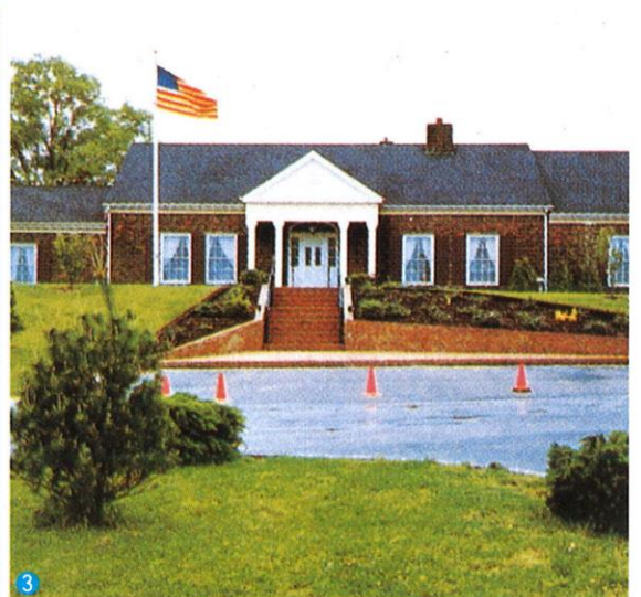
① 歓迎レセプション ② オールド・ヒッコリー湖畔でのキャンプ ③ ヘンダーソンビル市シティーハウス