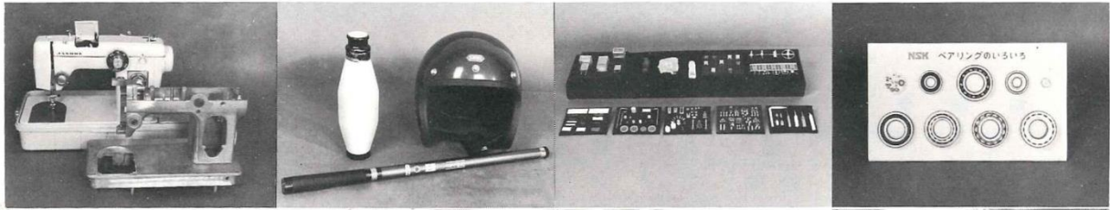
製造業の従業者・原材料使用額等 (昭和47年)