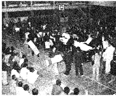
11月11日に行われた 当選証書附与式