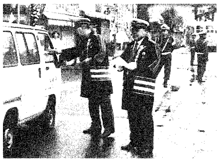
◀富士急行線駅八ヶ所で黄色い羽根の配布

交通事故は、誰が悪いのもなく、本人の責任によります。事故があつて喜ぶ人は誰もいません。自分自身が気をつけ、交通ルールを守りましょう。